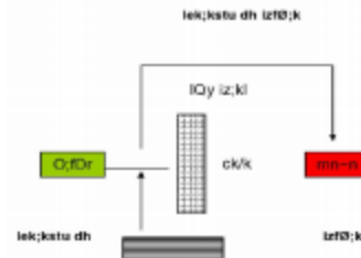
समायोजन की प्रक्रिया