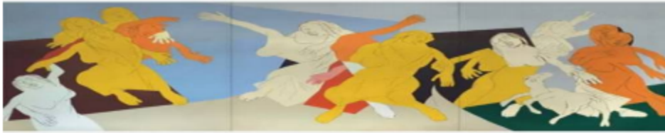
तैयब मेहता 'जर्न' (सेलिंगेशन) -1995, माध्यम- कैनवास पर एक्रैलिक रंग, संग्रह - नेशनल गैलरी ऑफ मॉडर्न आर्ट्स, (चित्र-सं०-1)

2- के०एस०कुलकर्णी (1916-1994 ई०) भित्ति चित्रकार, मूर्तिकार, छाया चित्रकार एवं शिक्षक रहे। भारतीय शास्त्रीय भाव को समकालीन जनजीवन तथा सामाजिक वातावरण से विश्लेषण कर यथार्थ व अमूर्त कला के संबंध प्रयोग से एक नवीन शैली की संरचना की। जिसमें रंग पट्टिकाओं तथा आकृतियां टेढ़ी-मेढ़ी व बिरूपित होते हुए भी स्वतंत्र रेखाओं, उत्तेजक रंगों तथा लयात्मकता से परिपूर्ण जीवंत है। साथ ही साथ आप दिल्ली शिल्पी चक्र के संस्थापक सदस्य रहे और त्रिवेणी कला संगम की स्थापना भी किये थे। आप ललित कला संकाय, बी.एच.यू. वाराणसी के संकाय प्रमुख भी थे। आप की प्रसिद्ध चित्र 'किसान' (चित्र सं० 2)के अवलोकन से यह ज्ञात होता है कि ज्यामितिय रूपों में बैलों व आदमी, धुसर मटमैला रंगों का प्रयोग किये। घनवाद का प्रभाव स्पष्ट परिलक्षित होता है। चित्र मूर्त-अमूर्त के बीच की कड़ी हैं जिसे अर्द्ध-अमूर्त कहते हैं। घनवाद पद्धति में चटक वर्ण से चित्रण किये हैं।