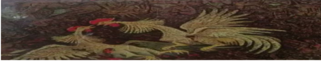
के. के. हेब्बेर चित्र : मुर्गे की लड़ाई, (तेल रंग, कैनवास, चंडीगढ़ संग्रहालय, चंडीगढ़ ) (चित्र सं०-4)

की चित्रकारी व लोक कला से प्रभावित थे। आपके कृतियों में पाल गोंगा व पाल सेजान का प्रभाव स्पष्ट है। प्रसिद्ध कृति : मुर्गे की लड़ाई धकोंक फाइट (चित्र सं०-4) (1959, कैनवास तेल रंग चंडीगढ़ म्यूजियम)। मुर्गे की लड़ाई प्रस्तुत कृति में दो मुर्गों को आक्रमक व रौद्र रूप में लड़ते हुए चित्रण है पृष्ठ भूमि में जनता को चित्रित किया गया है। रंग विधान मटमैले धुसर और लाल रंग का प्रयोग है। मुर्गों के पंख अस्थ व्यस्त व जमीन पर टूट कर विखरे पड़े हैं। दोनों मुर्गों को घायल व रक्त निकलते हुये दिख रहा है। जो कुल मिलाकर अर्द्ध-अमूर्तन में चित्रण हुआ है।