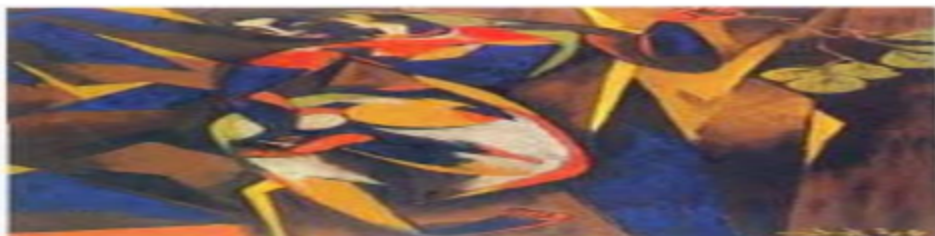
एन०एस०बेंद्रे चित्र कांटा(थान)1955 ई०,तैलरंग,कैनवास, रा०आ०क०दीर्घा, नई दिल्ली। (चित्र सं०-3)

3- एन.एस. बेंद्रे (1910-1992) आप समकालीन भारतीय चित्रकला के इतिहास में प्रसिद्ध हैं। सन् 1950 ई० के आस-पास संश्लेषणात्मक घनवादी प्रयोग किये, जिनमें आकृतियों को भारतीय शास्त्रीय व सौंदर्यात्मक लयात्मक कथा का प्रभाव दिखाई देता है। आपके चित्रों में मानवीय आकारों, प्रकृति चित्रों व स्टील लाइफ आदि प्रमुख विषय रहे। चित्रों में नव प्रभाववाद धर्बिंदुवाद, अभिव्यंजनावाद, अमूर्त अभिव्यंजनावाद, घनवाद का प्रभाव रहा है। इनके प्रसिद्ध चित्र कांटा (चित्र सं० 3) में एक महिला दाहिने पाँव में चुभे कांटे को निकलते हुये और बाएँ हाँथ में वृक्ष की टहानी लिए चित्रण हुआ है। चित्र में ज्यामितिय रूप को